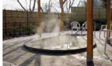
天然温泉「ほのぼの湯」

ほの字の里の「ほのぼの湯」は『ぬるっ』 とした独特の感触があり“美人の湯”として 好評なんです!! この機会にご利用ください。