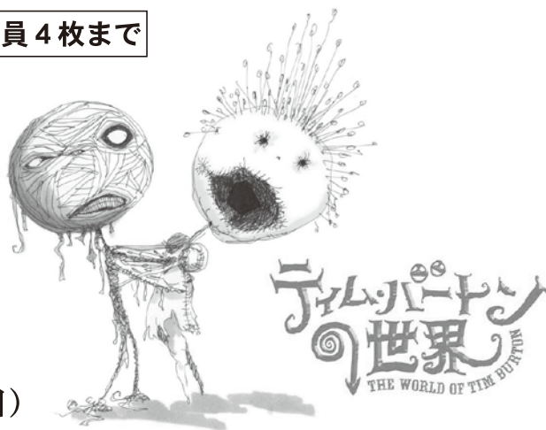
無題(『オイスター・ボーイの憂鬱な死』) 1982-1984年頃 (c)2014 Tim Burton

「シザーハンズ」「ナイトメア・ビフォア・クリスマス」「バットマン」「チャーリーとチョコレート工場」などの映画作品で知られるティム・バートン監督。同展では、可愛らしさと不気味さ、毒気と温かさが同居するバートン監督の世界を、スケッチ、デッサン、写真作品、オブジェ、手紙、10代の頃に撮影した日本未公開映像作品など、約500点から紐解いていきます。会場でしか手に入らないオリジナルグッズにも注目です！