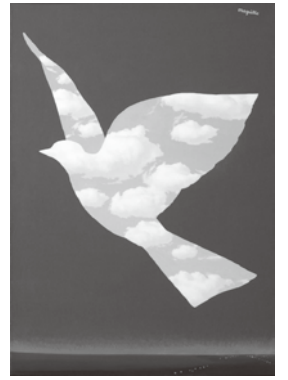
ルネ・マグリット 《空の鳥》 1966年 油彩/カンヴァス 68.5×48cm ヒラリー&ウィルバー・ロス蔵 Hilary & Wilbur Ross © Charly Herscovici/ADAGP, Paris, 2015

◆申込方法：事務局まで、電話・FAX・Eメールにてお申し込みください。(事業所名・会員氏名・チケット区分・必要枚数をお伝えください。)