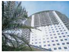
ホテルエミオン東京ベイ外観