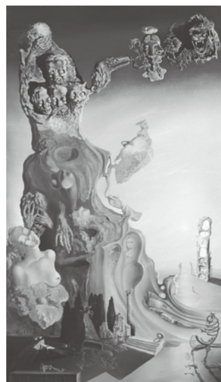
《子ども、女への壮大な記念碑》 1929年 国立ソフィア王妃芸術センター蔵 © Salvador Dalí, Fundació Gala-Salvador Dalí, JASPAR, Japan, 2016. Collection of the Museo Nacional Centro de Arte Reina Sofía