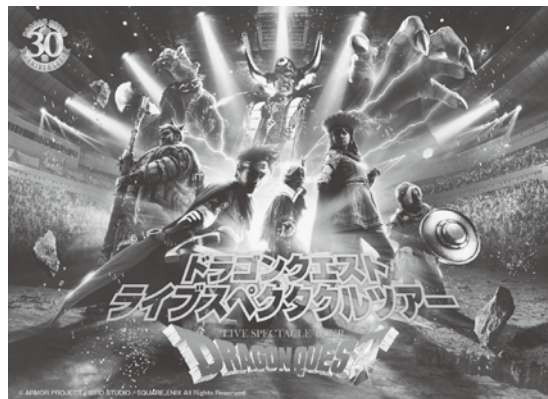
© ARMOR PROJECT/BIRD STUDIO/SQUARE ENIX All Rights Reserved.

今年で30周年を迎える伝説のRPG「ドラゴンクエスト」。この国民的ゲームの誕生を記念して、まるでゲームの世界に飛び込んだような観客参加型のライブエンターテインメントが開幕します!! モンスターとのバトルや呪文、エアリアル、ダンスを始めとしたトップパフォーマーによるパフォーマンスと最先端の映像テクノロジーの融合。今まで見たことのないショーをぜひご体感ください。