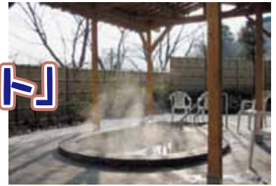
天然温泉「ほのほの湯」