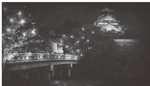
イメージ画像です

日が落ちた夜にしか体験できない、神秘的なナイトウォーク。それはきっと、魔法の瞬間になるはず。。。