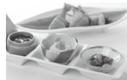
ダイヤモンド有馬温泉ソサエティ

<電話予約> 各ホテルへ直接お電話ください。その際、下記の会員名と会員番号をお伝えください。