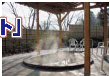
天然温泉「ほのぼの湯」

実は「ほの字の里」の天然温泉「ほのぼの湯」は「ぬるっ」とした独特の感触があり“美人の湯”として好評なんです！！今回ご紹介するのは、天然温泉入浴券付きのBBQプランです。この機会にご利用ください。