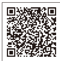
二色の浜観光協会