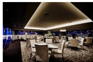
TERRACE & DINING ZERO