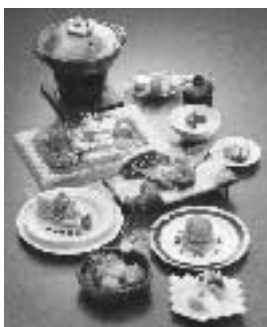
※イメージ (メニューは月替わりです)