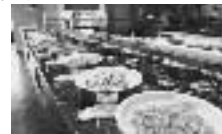
イタリアン バイキング

◇土日祝:スパークリング アフタヌーンティー バイキング ※60種類以上のデザートにピザ・サラダ等の軽食もご用意。 スパークリングワイン飲み放題、コーヒー・紅茶・ジュース付 【利用時間帯 15:00～17:00(16:30ラストエントリー)】