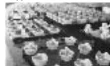
アフタヌーンティー バイキング